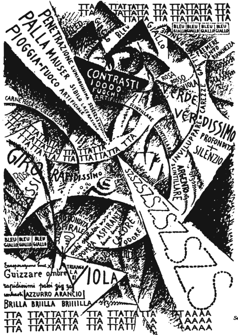
Severini: La danse du serpent. Lacerba -1 er juillet 1914.